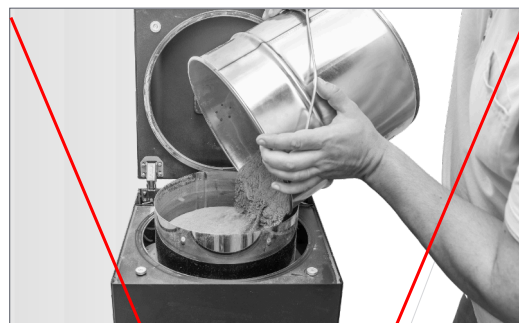
prosetí v sítu - alespoň 3x