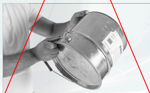
"šejkování" do požadované kvality

Jakákoli varianta ručního refreshování je fádní a časově náročná