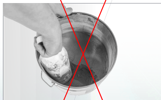
ruční míchání do požadované kvality